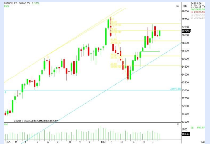
BANKNIFTY WEEKLY CHART