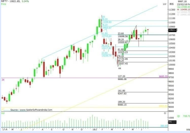
NIFTY WEEKLY CHART

ઉપરમાં ૨૨૫૮૮.૦૦ અને નીચામાં ૨૧૯૩૨.૪૦ નો ભાવ જોવા મળ્યો હતો.