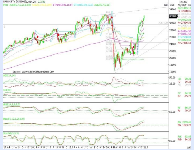
BANKNIFTY WEEKLY CHART