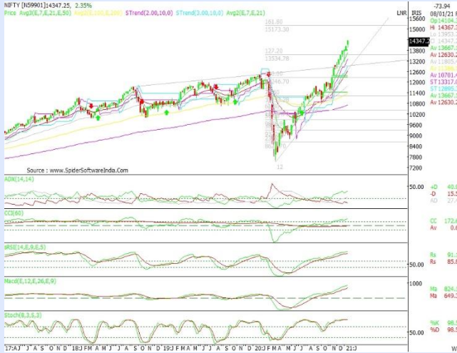
NIFTY WEEKLY CHART

ઉપરમાં ૧૪૯૬૬.૮૦ અને નીચામાં ૧૪૭૬૬.૮૦ નો ભાવ જોવા મળ્યો હતો.