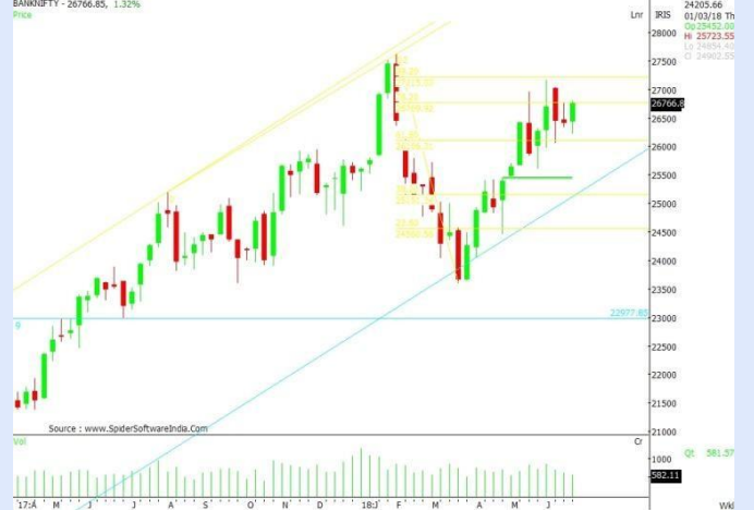
BANKNIFTY WEEKLY CHART