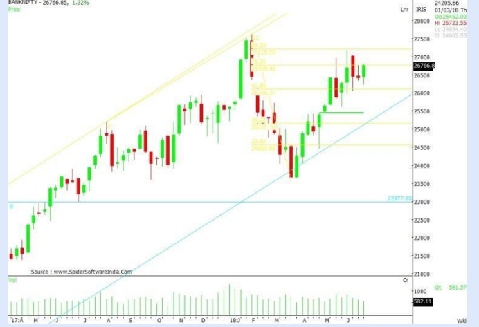
BANKNIFTY WEEKLY CHART